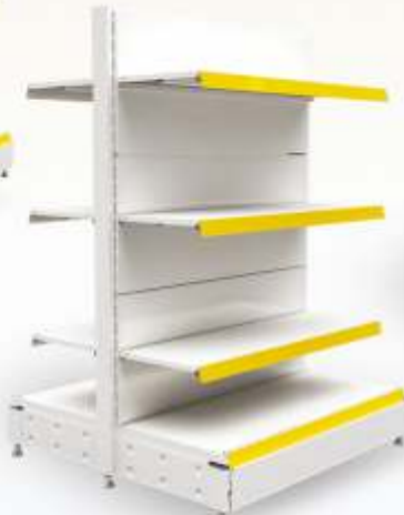
Çift yönlü orta reyon Double sided mid units