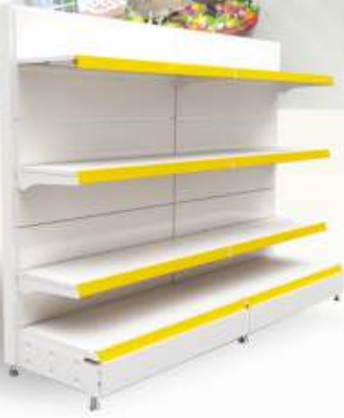
Tek yönlü orta reyon Single Side Mid Units