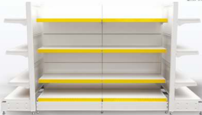
Çift yönlü orta reyon Double sided mid units