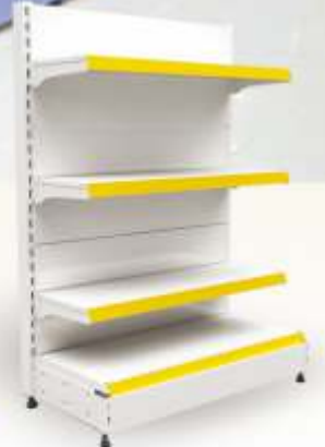
Reyon başı Gandolas