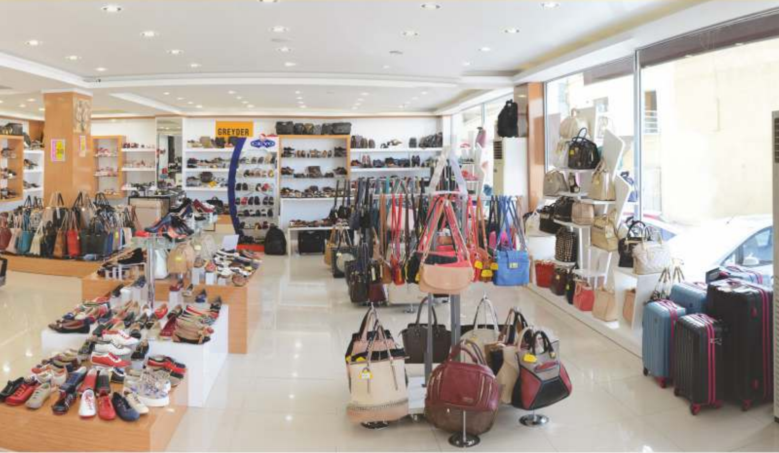
The stores whose each corner designed by care