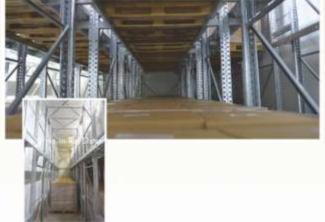
Drive-in Raf Sistemi Drive-in Shelving System