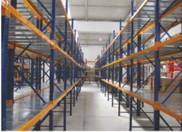
Mini Rack Raf Sistemi Mini Rack Shelving System