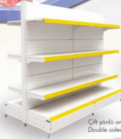
Çift yönlü orta reyon Double sided mid units