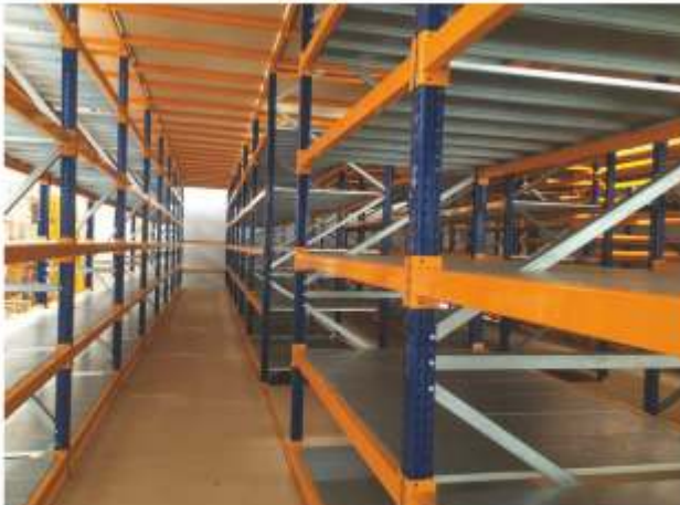
Mezanin Raf Sistemi Mezzanine racking systems