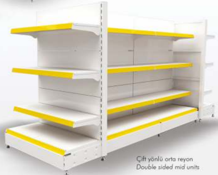
Çift yönlü orta reyon Double sided mid units